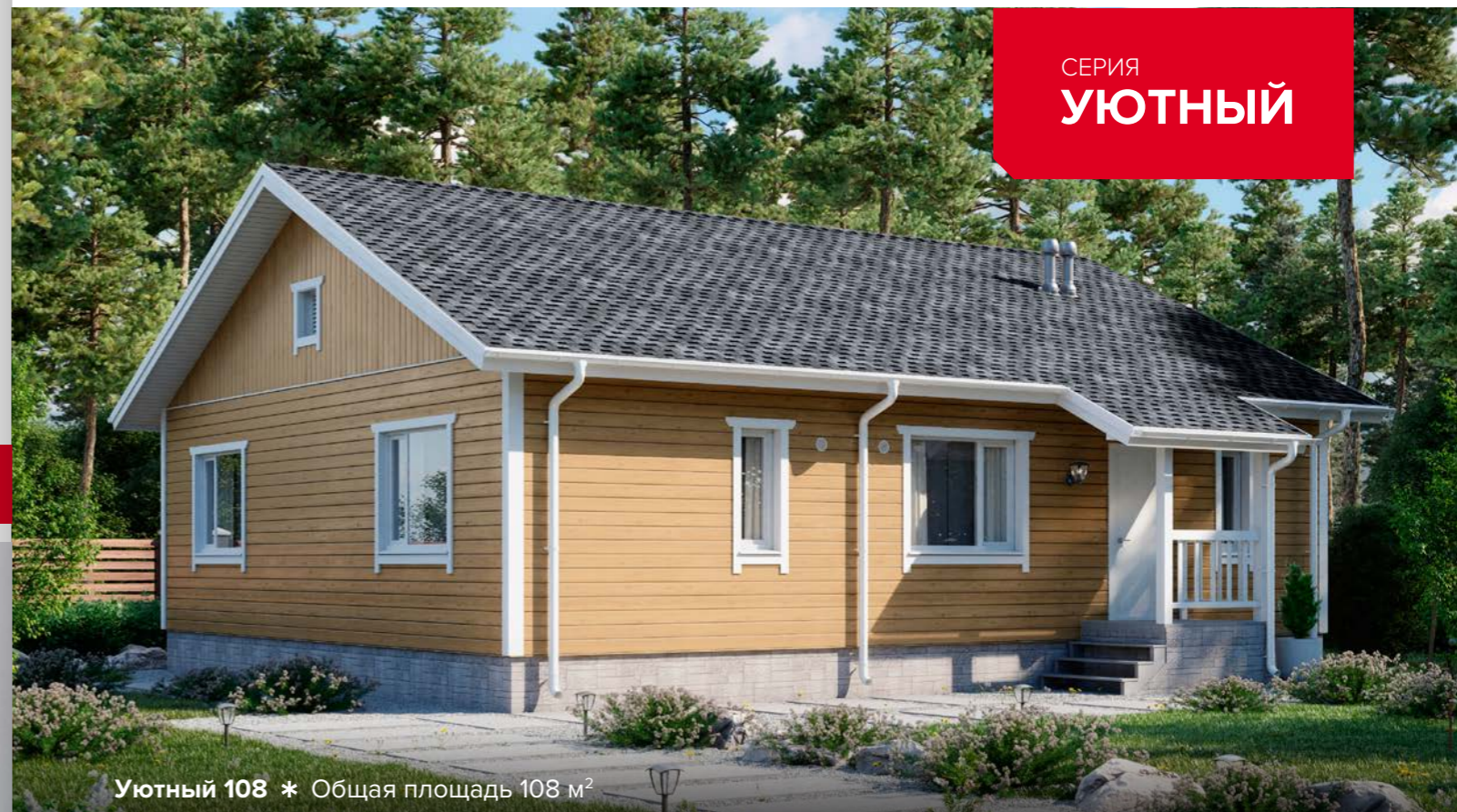
Уютный 108 * Общая площадь 108 м 2